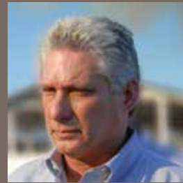
Miguel Diaz Canel Le nouveau Président de Cuba