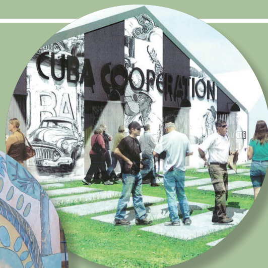
Premier forum national de la coopération entre la France et Cuba du 13 au 15 septembre 2013 à La Courneuve