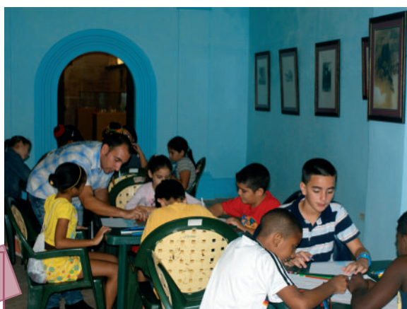
Les enfants participant à un atelier de dessin sur le thème des Misérables.