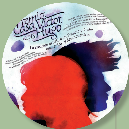
Coopération culturelle avec la Maison Victor Hugo de La Havane