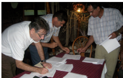
Chaque mission sur place est l'occasion de signer de nouveaux documents, les uns clôturant des réalisations, les autres permettant le démarrage de nouveaux projets.

Après 7 années qui ont permis la réalisation plus ou moins terminée d'une trentaine de projets grâce au Réseau des Amis de Cienfuegos mis en place en 2006 (voir revues antérieures), nous comptabilisons un financement global de près de 500 000 € ayant bénéficié à plus de la moitié de la population de la province de manière