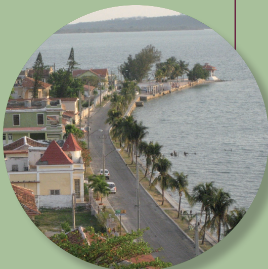
Depuis 2006, 30 projets réalisés dans le programme de développement de la province de Cienfuegos