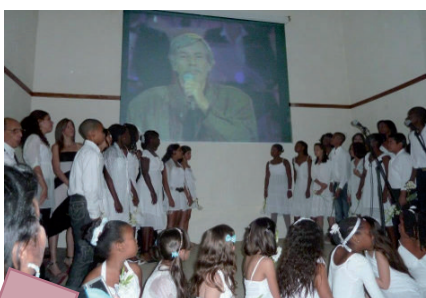
Le final « la Paix sur terre » repris en chœur par la salle toute entière.