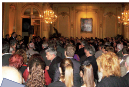
Gala : Avec près de 480 convives invités par une cinquantaine de décideurs d'entreprises, la soirée de gala de janvier 2013 au Cercle de l'Union interalliée à Paris a marqué par la qualité de son organisation, de sa convivialité et des prestations offertes à un public de plus en plus fidèle à cette initiative. Rappelons que le fruit de cette soirée constitue une part essentielle du budget de fonctionnement de l'association et une contribution non moins importante pour le financement direct de projets. Merci à tous les entrepreneurs qui nous renouvèlent chaque année leur confiance !

Toutes ces structures plus ou moins organisées, auront permis de réunir en France plusieurs centaines de personnes dans diverses activités : conférences, débats, expositions, projections de films, repas festifs, collectes, ... que l'organisation nationale n'aurait pu mener seule. Elles ont également permis de créer de nouvelles coopérations entre les régions françaises et Cuba (en particulier l'Armor, l'Hérault et le Loir et Cher).