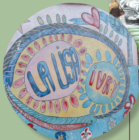
Favoriser les coopérations décentralisées pour créer des échanges institutionnels et citoyens, comme la ville d'Ivry qui signait avec La Lisa (un arrondissement de La Havane) le premier accord en 1997