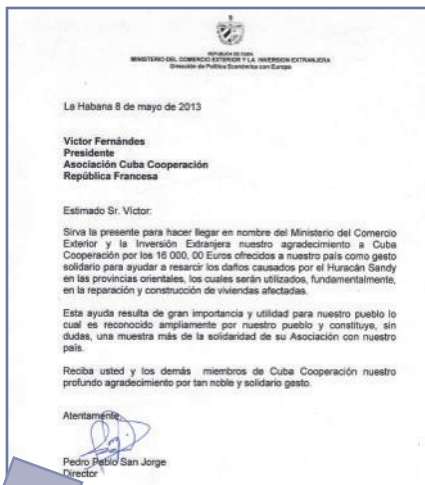
OURAGAN : Le Ministère cubain de la Coopération remercie la collecte organisée par Cuba Coopération et informe de son utilisation prioritaire dans la reconstruction de logements.

Cuba Coopération a aussitôt répondu à l'élan de solidarité en lançant une collecte de fonds et en envoyant dès novembre 16 000 € (dont 10 000 € sur fonds propres). La collecte se poursuit pour répondre aux urgences.