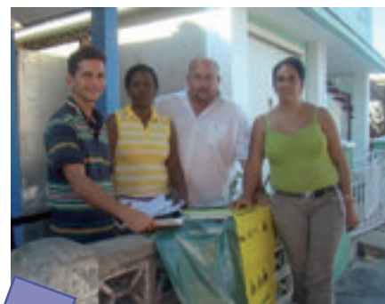
Distribution à la population des sacs et des guides de tri par les services municipaux de Cienfuegos.

Ce type d'échanges, de caractère technique, entre collectivités territoriales des deux pays, et portant sur des sujets fondamentaux, ici la gestion des déchets, mais ailleurs pouvant porter sur d'autres thèmes, la gestion de la ressource en eau, l'agriculture, la santé... est, croyons nous, appelée à se développer.