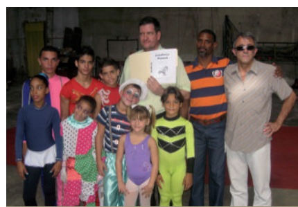
Visite à l'atelier de cirque en novembre 2012 avec les représentants de Bagnolet

Le choix de Cuba Coopération de cofinancer la création du Centre de documentation du Parc (voir ci-dessous) était essentiel car cette structure jouera un rôle moteur dans la réflexion et la coordination des coopérations à venir. La diversité des sujets et des budgets