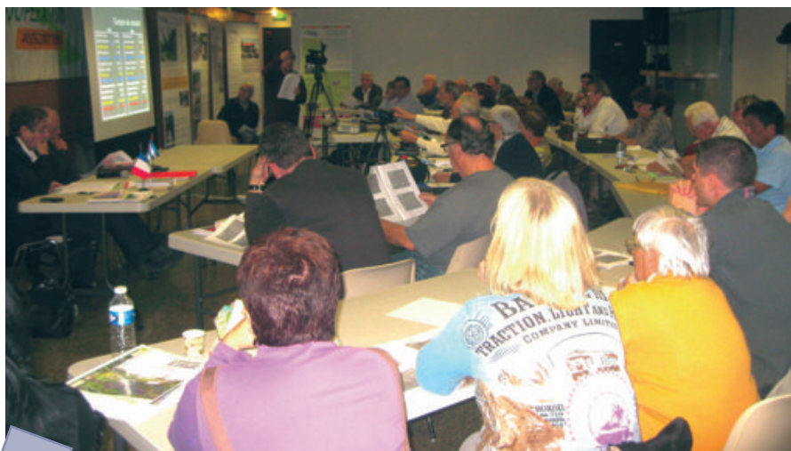
Les travaux de la dernière AG d'octobre 2012