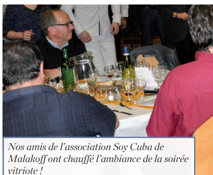
Nos amis de l'association Soy Cuba de Malakoff ont chauffé l'ambiance de la soirée vitriote !