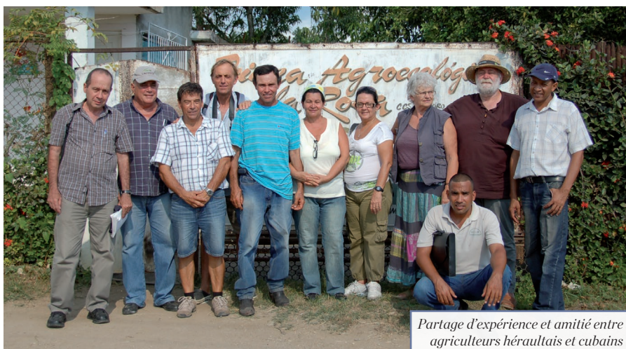
Partage d'expérience et amitié entre agriculteurs héraultais et cubains

l'importante coopération entre l'Agglomération, Haïti et Cuba.