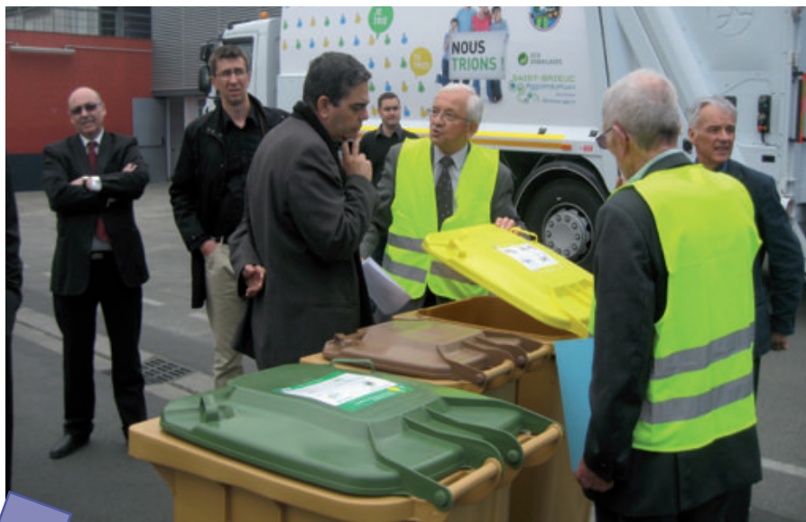
Avril 2011, à l'initiative de Cuba Coopération et de notre relai en Armor, l'Ambassadeur de Cuba nous accompagne dans une première visite à Saint Briec qui déclenche ce qui s'avèrera être une « première » en matière de coopération dans ce domaine d'activités.

Fort de ce début de coopération, l'Agglo de St Briec a proposé à la Ville de Cienfuegos de poursuivre dans cette voie en accueillant pour un « stage de formation » le responsable adjoint des