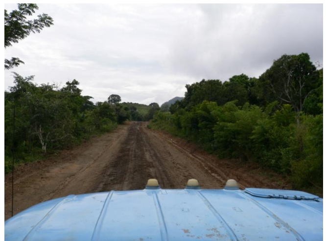
En route pour une exploitation agricole de montagne Nov 2010

Biozone 2012 peut être « la première pierre » en Bretagne. C'est l'objectif des acteurs de cette rencontre !