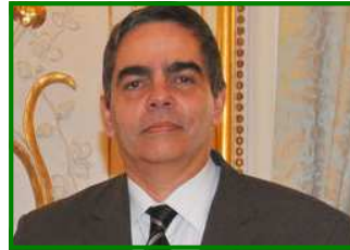
Orlando REQUEIJO GUAL Ambassadeur de Cuba en France.

« Cuba Coopération est un partenaire-clef des échanges entre nos deux pays.