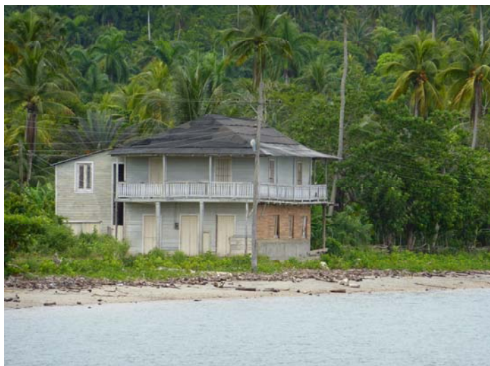
Photo brut sans texte pour illustrer notre document , non exhaustif .

BAIE DE MATA , Province de Guantanamo , BARACUA , seule maison restant de l'arrivé des premiers français à Cuba , toujours habité par des descendants de Français .