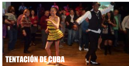
TENTACIÓN DE CUBA