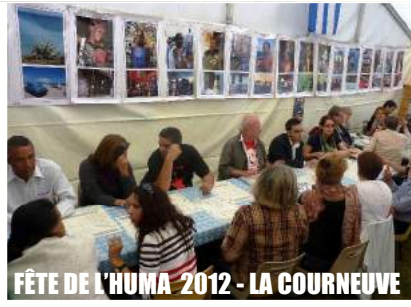
FÊTE DE L'HUMA 2012 - LA COURNEUVE