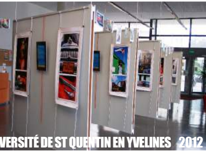
UNIVERSITÉ DE ST QUENTIN EN YVELINES 2012