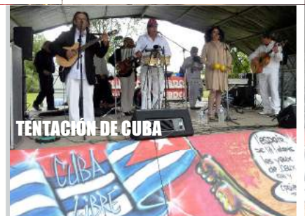
TENTACIÓN DE CUBA