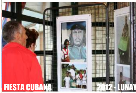
FIESTA CUBANA 2012 - LUNAY