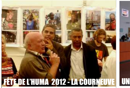
FÊTE DE L'HUMA 2012 - LA COURNEUVE