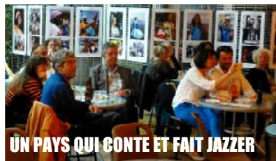
UN PAYS QUI CONTE ET FAIT JAZZER

Les journées « A la découverte de Cuba », les opérations « Cinécuba » et « Fiesta cubana », les initiatives « Cuba, un pays qui conte et fait jazer », « Femme à Cuba » et, depuis décembre 2015, l'exposition « Arte cubano » ont été l'occasion d'inviter des artistes cubains, de faire découvrir aux publics divers des œuvres de haut niveau, voire de créer parfois de riches complicités ou de belles convergences.