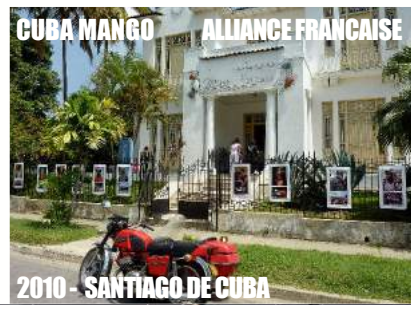
CUBA MANGO ALLIANCE FRANÇAISE 2010 - SANTIAGO DE CUBA