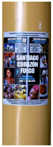
SANTIAGO CORAZÓN Y FUEGO