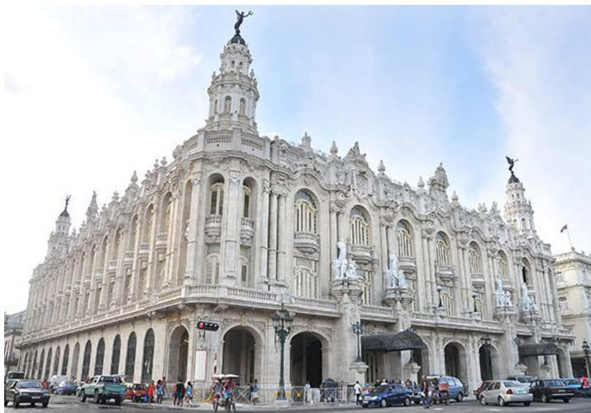
Gran Teatro Nacional Alicia Alonso de LA HABANA, Siège du Festival International de Ballet de LA HAVANE

Dans ces relations entre la France et le ballet cubain, les liens étroits tissés avec la présence de danseurs, de chorégraphes et des personnalités de ce pays dans les différentes célébrations du FESTIVAL