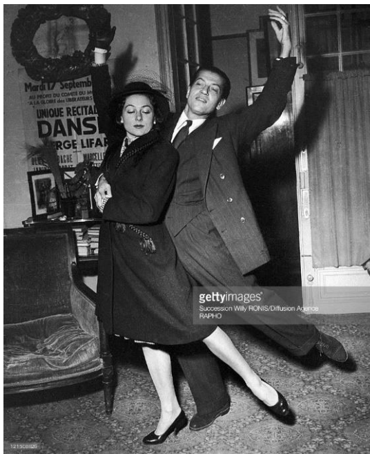
YVETTE CHAUVIRÉ et SERGE LIFAR (1947)

En 1959, la célèbre YVETTE CHAUVIRÉ (27) la danseuse étoile de l'Opéra de Paris, a présenté ses « Récitals de Ballet » dans le théâtre Auditorium, comptant des titres avec la musique de SAINT-SAËNS, de DANIEL AUBER (28) et « La suite en blanc », une célèbre chorégraphie de SERGE LIFAR une partition d'ÉDOUARD LALO (29) . Les Ballets de Paris se présentent cette même année avec le célèbre danseur MILORAD MISKOVITCH (30) .