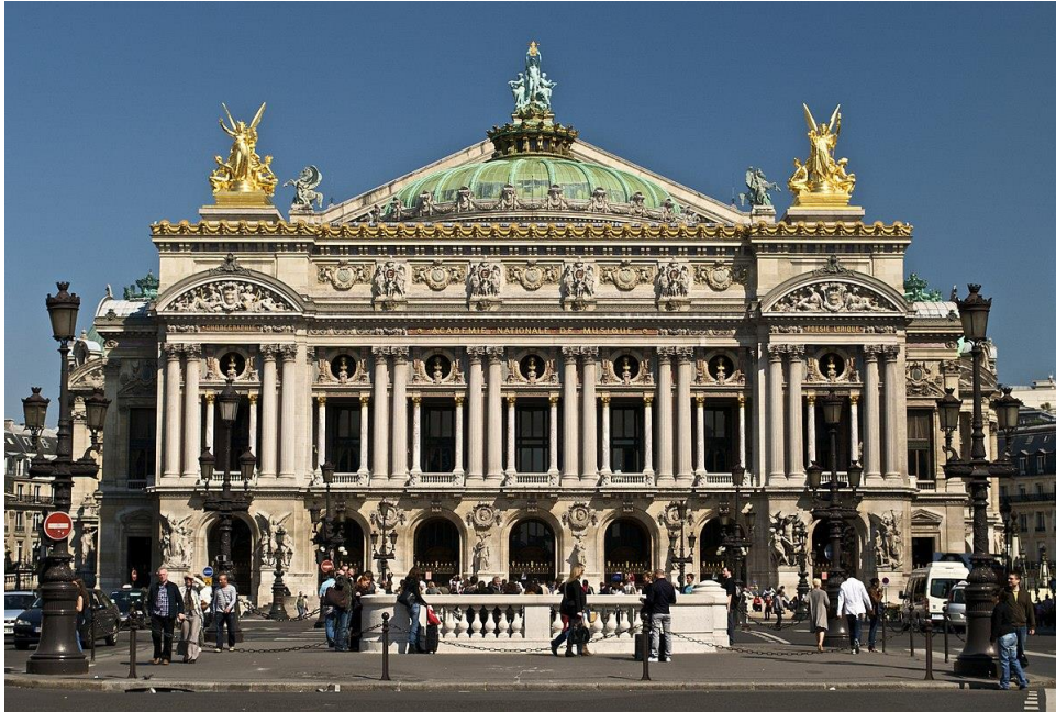
L'OPERA de PARIS

Dans cette Académie, devenue OPERA DE PARIS à partir de 1713, sont nés les deux grands genres et styles qui ont fleuri dans les siècles suivants : le ballet d'action et le romantisme, qui ont trouvé un terrain fertile dans les endroits les plus divers de la terre.