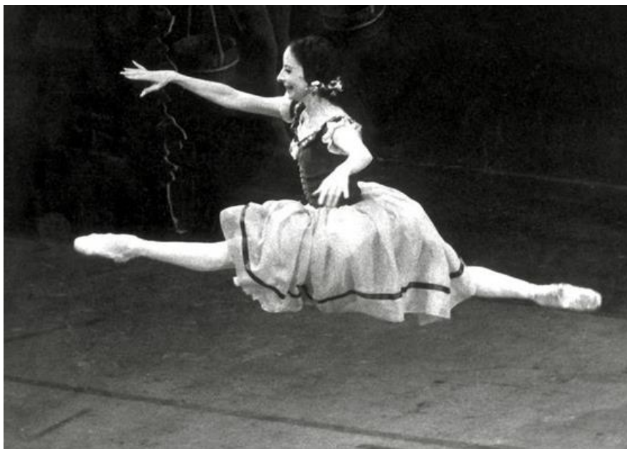
Alicia ALONSO dans le ballet GISELLE

Ce lien indissoluble d'ALICIA ALONSO avec le ballet français aura son point culminant le 2 novembre 1943, quand elle a assumé le rôle principal du ballet « Giselle », fruit du travail de cinq grands créateurs français : les chorégraphes JULES PERROT et JEAN CORALLI ; le compositeur ADOLPHE ADAM (36) et les librettistes THÉOPHILE GAUTIER (37) et VERNROY DE SAINT-GEORGES (38) avec lequel la danseuse cubaine, durant six décennies, a été acclamée dans le monde entier.