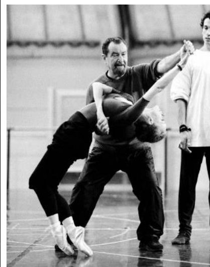
MAURICE BÉJART en répétition

En 1970, les relations franco-cubaines dans le domaine du ballet se sont resserrées avec la visite du Grand Ballet Classique de France , à La Havane, comptant l'ancienne danseuse étoile de l'Opéra LYANE DAYDE (32) , qui a présenté au public un répertoire composé essentiellement d'œuvres de SERGE LIFAR, une notable personnalité comme danseur, chorégraphe et directeur de l'OPERA DE PARIS durant plusieurs décennies.