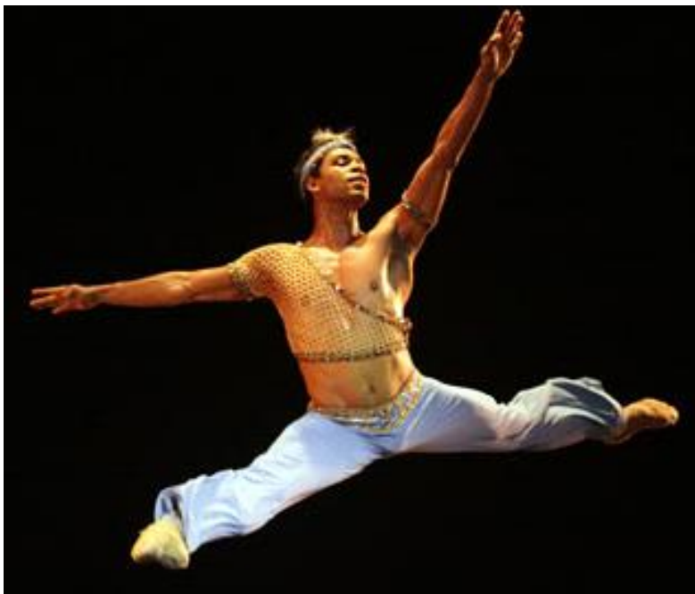
CARLOS ACOSTA dans le ballet SPARTACUS