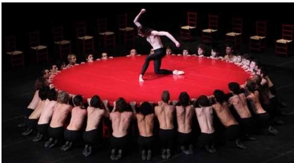
LE BOLÉRO : BALLET DU XXÈME SIÈCLE, chorégraphie de MAURICE BÉJART (Le Boléro de Ravel est joué toutes les 15 minutes dans le monde).

Un autre événement important pour Cuba a été la visite, en 1968, de MAURICE BÉJART (31) et de son Ballet du XXe siècle , lors de laquelle le public cubain a eu son premier contact avec l'œuvre de l'illustre chorégraphe français, qui sur la scène de l'aujourd'hui GRAND THÉÂTRE DE LA HAVANE ALICIA ALONSO, a montré certaines de ses créations célèbres, dont le « Boléro », sur la musique de RAVEL.