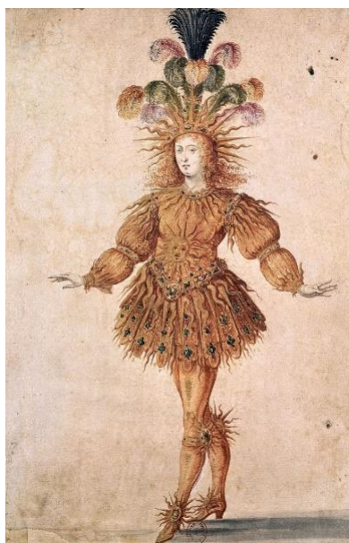
Représentation de LOUIS XIV : « Le roi soleil » (mise en scène du pouvoir absolu)

S'il est vrai que le ballet a ses origines en Italie lors de la Renaissance, une période où les maîtres de danse ont réussi à créer ce nouveau genre à partir de l'héritage de la danse populaire accumulée au cours du Moyen Âge, ce sera en France où ces spectacles ont atteint la catégorie d'art professionnel. Apporté dans la capitale française par la florentine CATHERINE DE MÉDICIS (1) la reine de ce pays après son mariage avec HENRI II (2) le « balletto » italien est devenu le « ballet » français, après le soutien décisif du roi LOUIS XIV (3) qui, en 1661, a créé l'ACADÉMIE ROYALE DE DANSE, la première institution dédiée à la formation de danseurs professionnels dans le monde occidental. Là, le maître PIERRE BEAUCHAMP (4) non seulement l'a réglementé, mais il a donné la nomenclature des pas et des poses et il a établi les cinq positions de base pour les bras et les jambes en vigueur dans le monde entier jusqu'à nos jours.