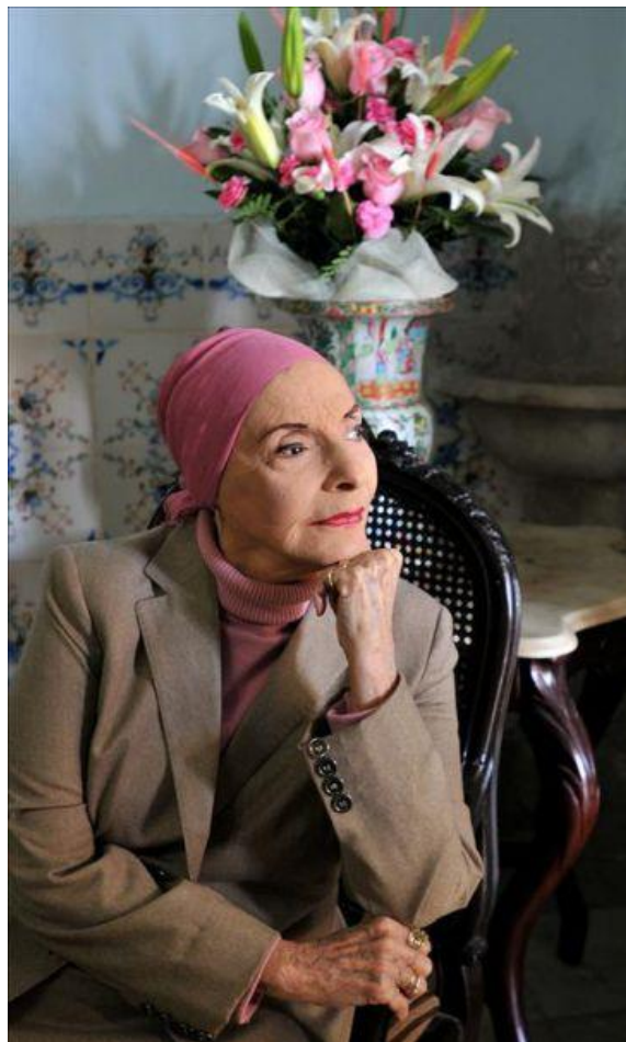
Alicia ALONSO « Prima Ballerina Assoluta »