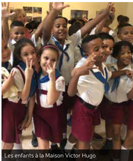
Les enfants à la Maison Victor Hugo