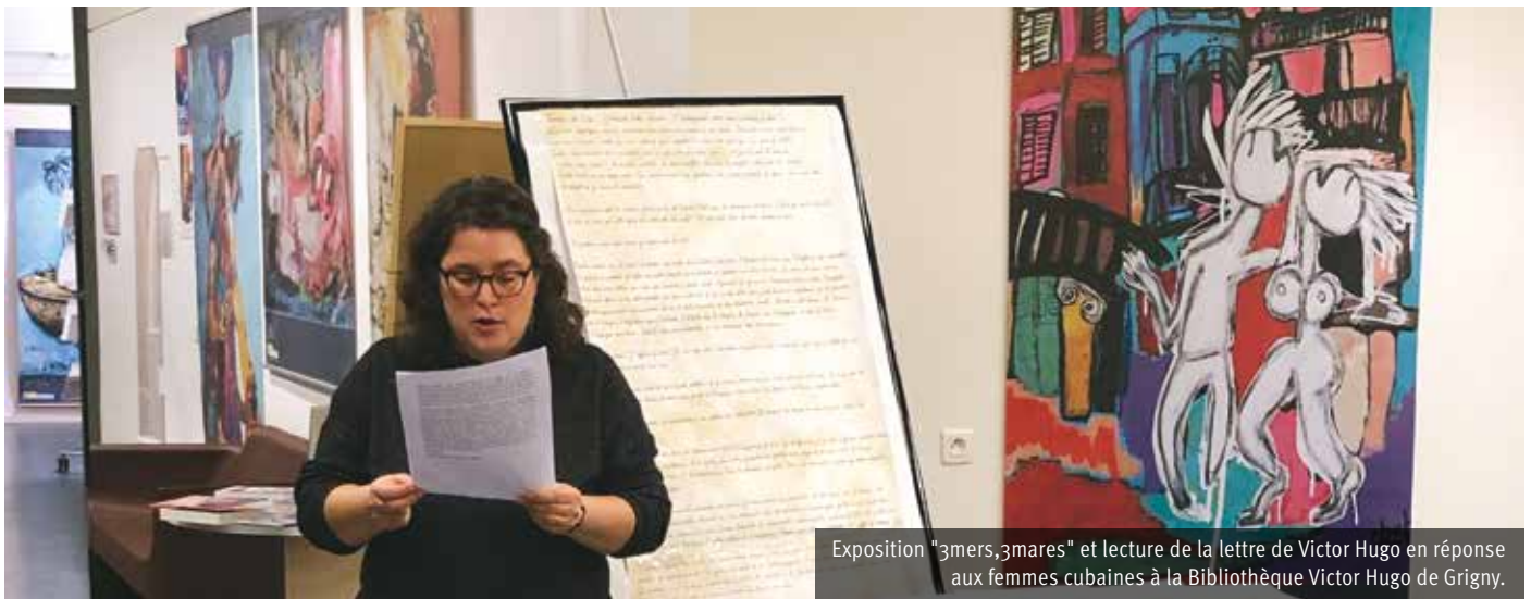
Exposition "3mers,3mares" et lecture de la lettre de Victor Hugo en réponse aux femmes cubaines à la Bibliothèque Victor Hugo de Grigny.