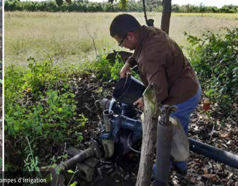
Une des actuelles pompes d'irrigation