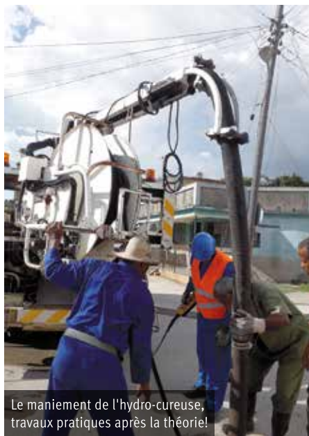
Le maniement de l'hydro-cureuse, travaux pratiques après la théorie!

Au plan administratif la maîtrise d'ouvrage sera assurée par le bureau de l'historien qui prévoit une durée globale de deux ans et garde la maîtrise d'œuvre pour les panneaux solaires et la délègue à l'INRH pour l'eau et l'assainissement, qui demande trois mois pour l'étude hydraulique (analyse de l'eau et détermination des caractéristiques de la pompe).