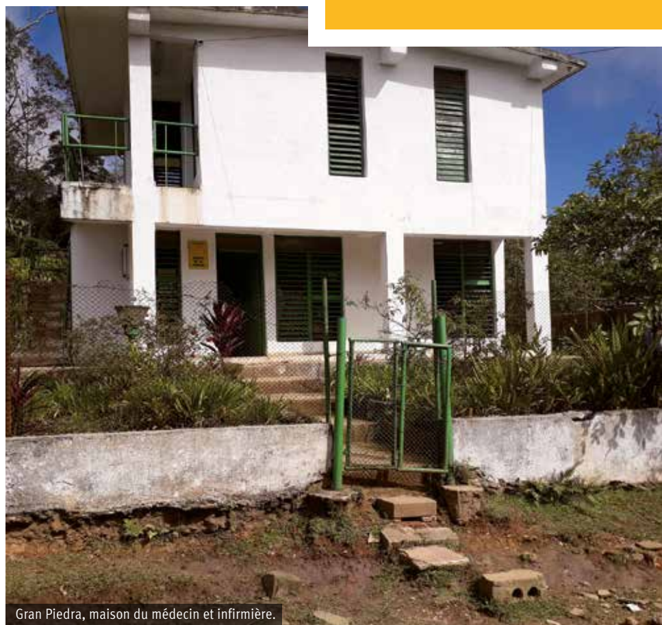
Gran Piedra, maison du médecin et infirmière.

Le Président JF Kennedy décide un embargo total contre Cuba.