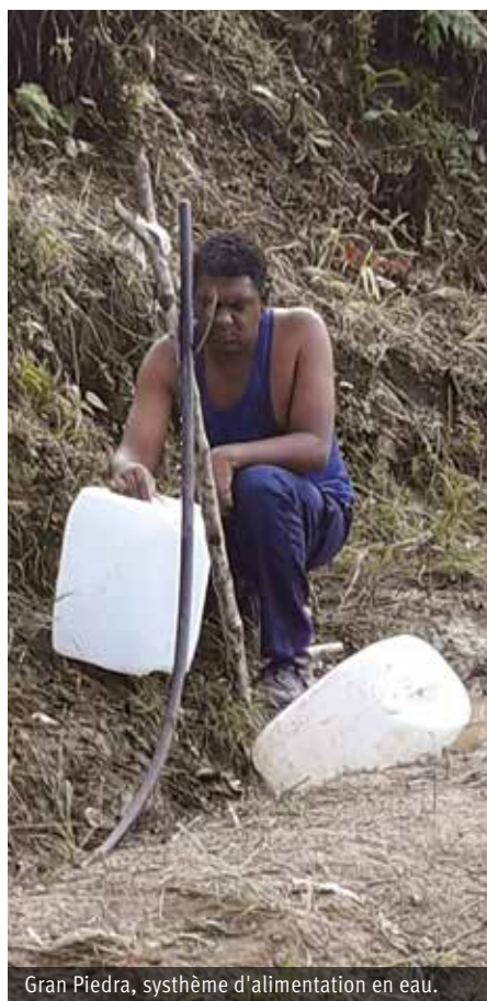
Gran Piedra, système d'alimentation en eau.