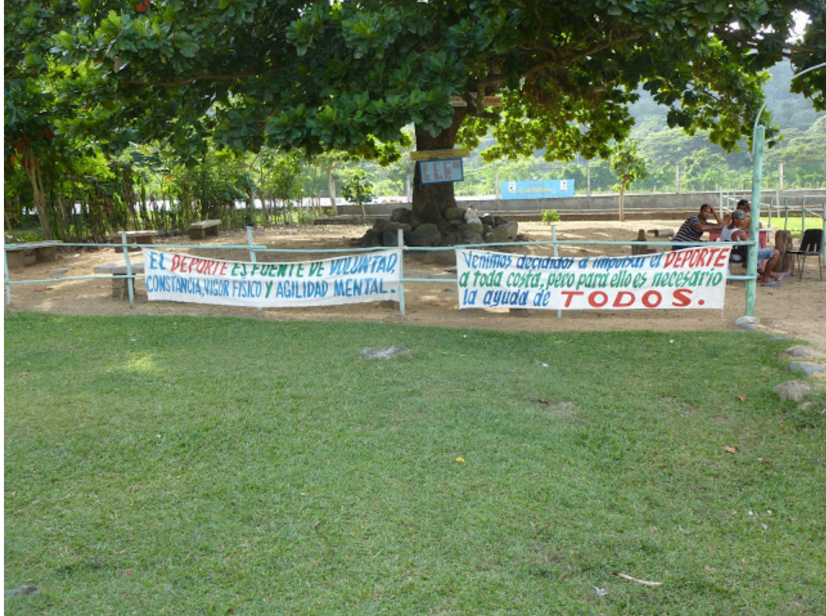
L'area de recreacion sana