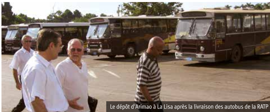
Le dépôt d'Armaio à La Lisa après la livraison des autobus de la RATP