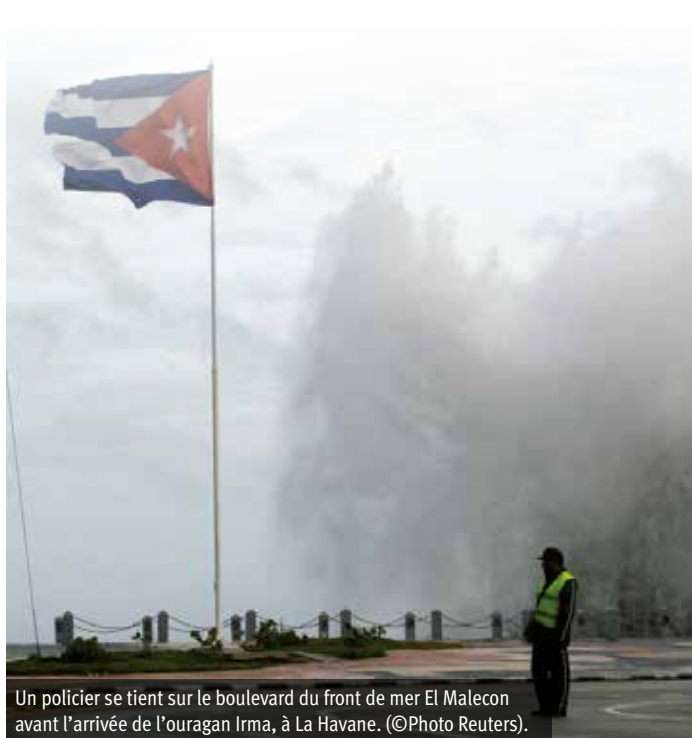
Un policier se tient sur le boulevard du front de mer El Malecon avant l'arrivée de l'ouragan Irma, à La Havane. (©Photo Reuters).

Nous poursuivons notre action de solidarité et continuons à recueillir les dons. Nous tiendrons nos lecteurs informés de l'usage fait de cet argent.