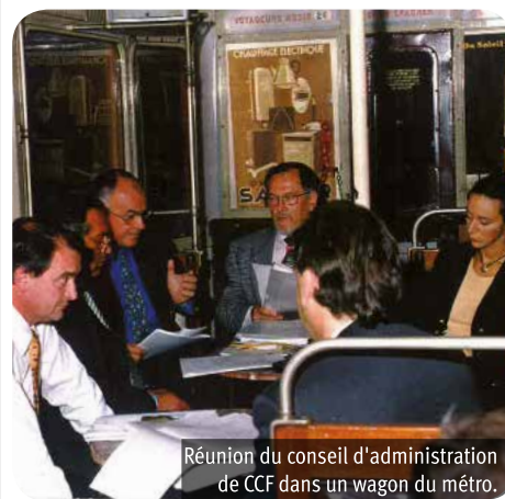
Réunion du conseil d'administration de CCF dans un wagon du métro.