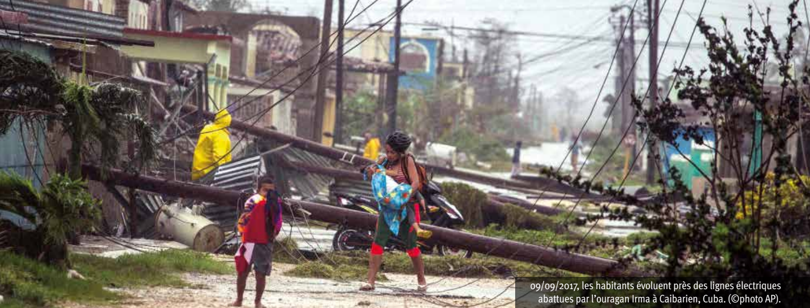
09/09/2017, les habitants évoluent près des lignes électriques abattues par l'ouragan Irma à Caibarien, Cuba. (©photo AP).