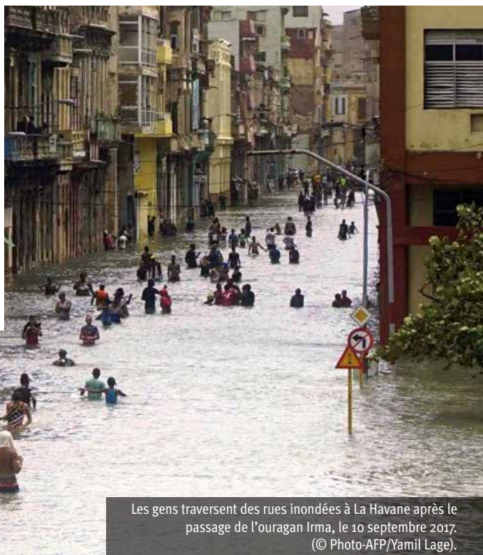
Les gens traversent des rues inondées à La Havane après le passage de l'ouragan Irma, le 10 septembre 2017..