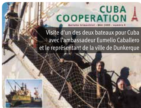
Visite d'un des deux bateaux pour Cuba avec l'ambassadeur Eumelio Caballero et le représentant de la ville de Dunkerque

Les besoins étaient énormes dans tous les domaines. Nous voulions contrer le blocus, expliquer en France ses nuisances catastrophiques et rassembler tout ce qui pouvait être offert à Cuba.