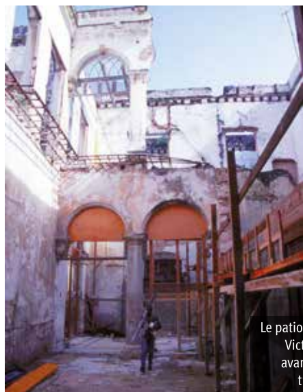
Le patio de la Maison Victor Hugo, avant et après travaux