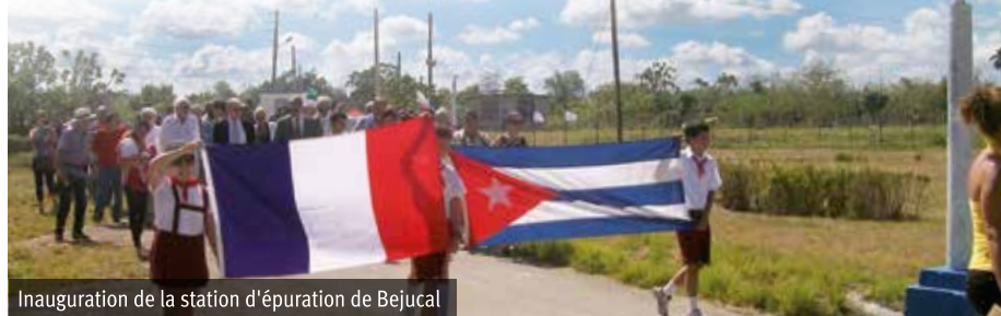
Inauguration de la station d'épuration de Bejucal