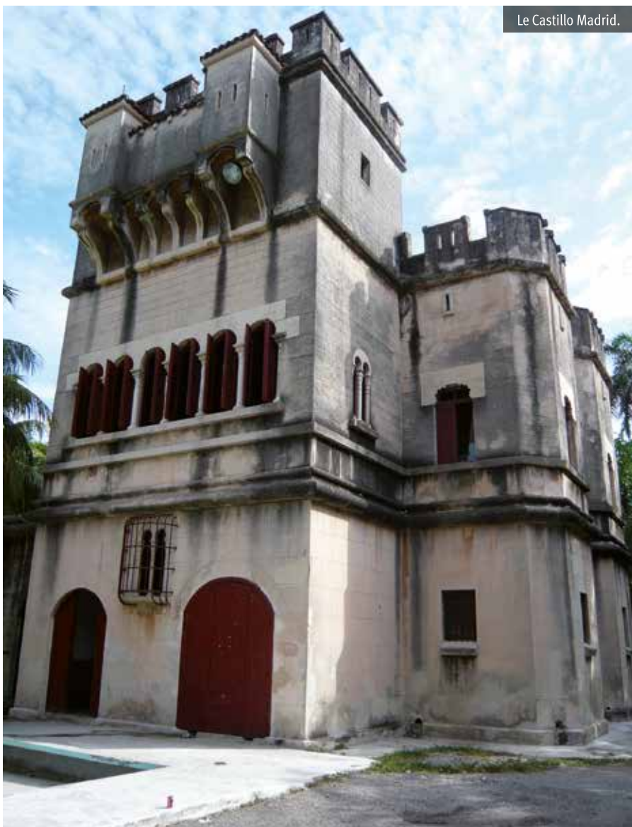
Le Castillo Madrid.