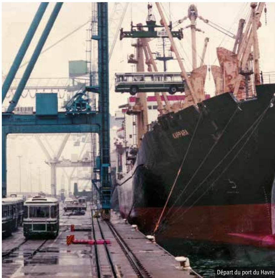
Départ du port du Havre