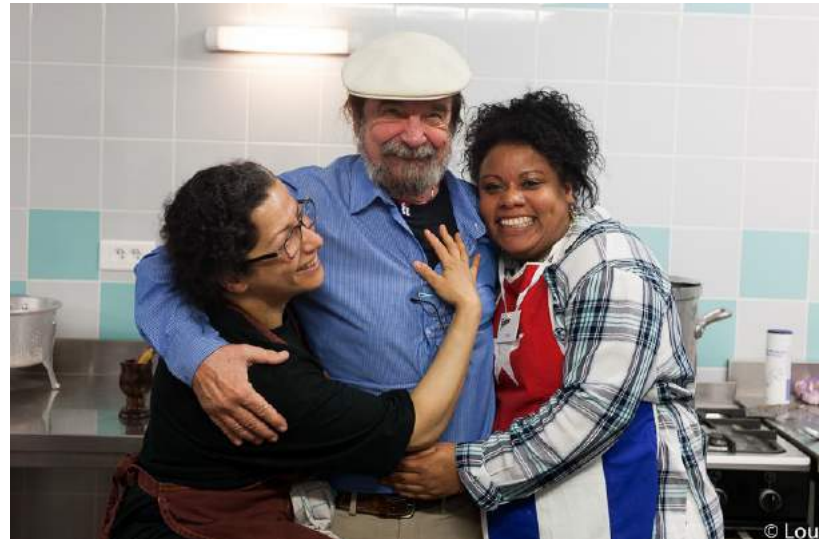
Les cuisinières accueillent les renforts

tandis que le trésorier veille à l'entrée de la salle à ce que personne ne rentre sans avoir réglé la modeste contribution demandée pour le repas concert ou pour le concert seul.