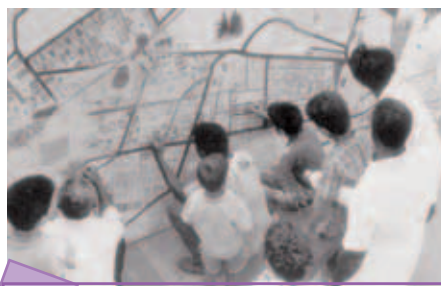
Atelier participatif de programmation locale

Cuba s'est engagé depuis plusieurs années dans une politique de décentralisation qui confère aux villes et provinces, la responsabilité du développement local sous toutes ses facettes. Elle implique une forte participation des organisations et associations locales, de la population pour répondre au mieux à leurs besoins et à leurs attentes. Cette politique s'inscrit également dans la mise en œuvre des grands objectifs fixés par l'ONU en septembre 2000, lors du Sommet du Millénaire. Ces objectifs sont à adapter à la situation spécifique de Cuba, internationalement reconnue pour ses très bons résultats dans l'Education, la Culture et la Santé en particulier.