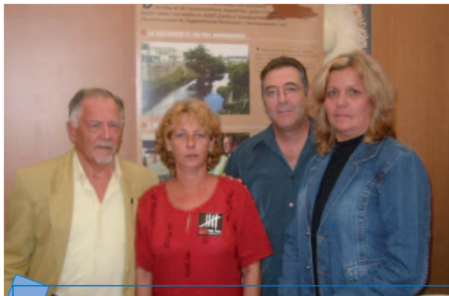
Lors de la dernière Fête de l'Humanité, discussion sur notre stand avec l'épouse d'un des « 5 »