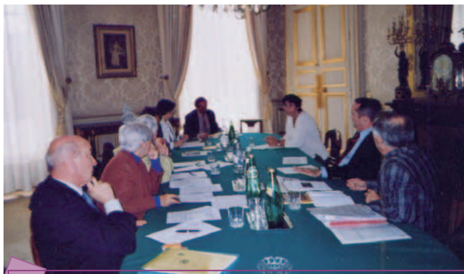
“Dernière réunion au Sénat du collectif d'aide à la programmation de la Maison Victor Hugo”