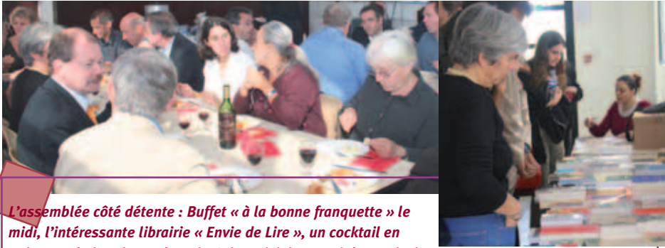
L'assemblée côté détente : Buffet « à la bonne franquette » le midi, l'intéressante librairie « Envie de Lire », un cocktail en présence de l'Ambassadeur de Cuba suivi d'une soirée musicale « caliente » autour d'une paella géante ...