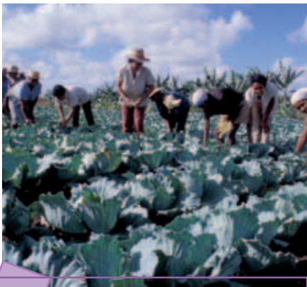
Diversification de l'alimentation et insertion économique des femmes grâce à la création d'un potager

Le PDHL est déjà implanté dans sept provinces cubaines (Pinar del Río, Granma, Holguín, Las Tunas, Guantánamo, Santiago de Cuba et Sancti Spiritus) et dans la municipalité de la Vieille Havane.